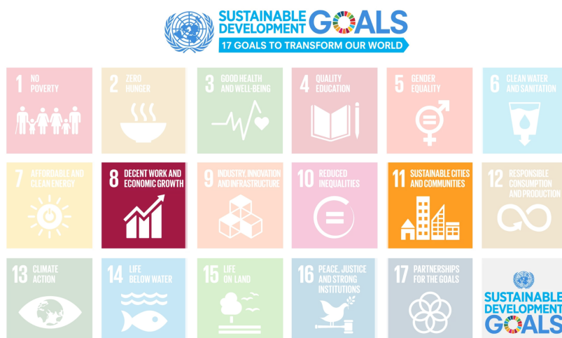
Gambar 1. Sustainable Development Goals (SDGs)

Sesuai dengan Gambar 1 Orange Technology memiliki keterkaitan langsung dengan agenda pembangunan global atau yang lebih dikenal dengan Sustainable Development Goals (SDGs) , khususnya SDGs 8 yang mendorong peningkatan produktivitas ekonomi secara inklusif, serta SDGs 11 yang menekankan pelestarian budaya lokal dan penguatan partisipasi sosial masyarakat. Dengan demikian, digitalisasi yang diselaraskan dengan nilai kemanusiaan tidak hanya memperkuat daya saing usaha mikro kreatif, tetapi juga berpotensi menghadirkan manfaat sosial yang lebih luas bagi komunitas [6].