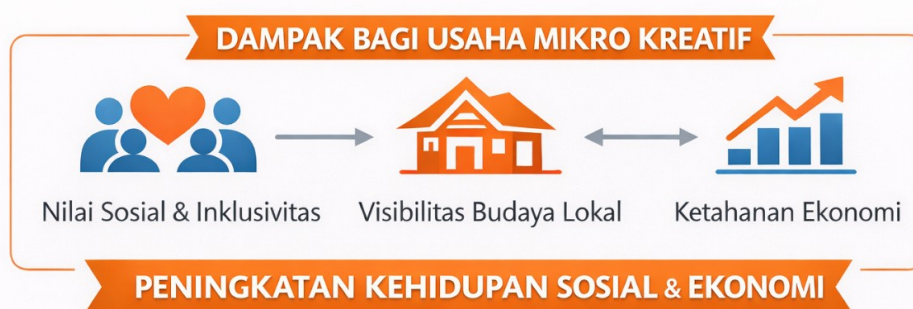
Gambar 2. Dampak Orange Technology pada Usaha Mikro Kreatif

Untuk memberikan gambaran yang lebih sistematis mengenai hasil atau dampak utama dari penerapan teknologi pada usaha mikro kreatif, disajikan sebuah diagram yang merangkum keterkaitan antara peningkatan nilai sosial dan inklusivitas, visibilitas budaya lokal, serta ketahanan ekonomi. Diagram ini berfungsi sebagai representasi konseptual yang membantu memahami bagaimana dampak-dampak tersebut saling mendukung dan berkontribusi pada peningkatan kualitas kehidupan sosial dan ekonomi masyarakat secara berkelanjutan.