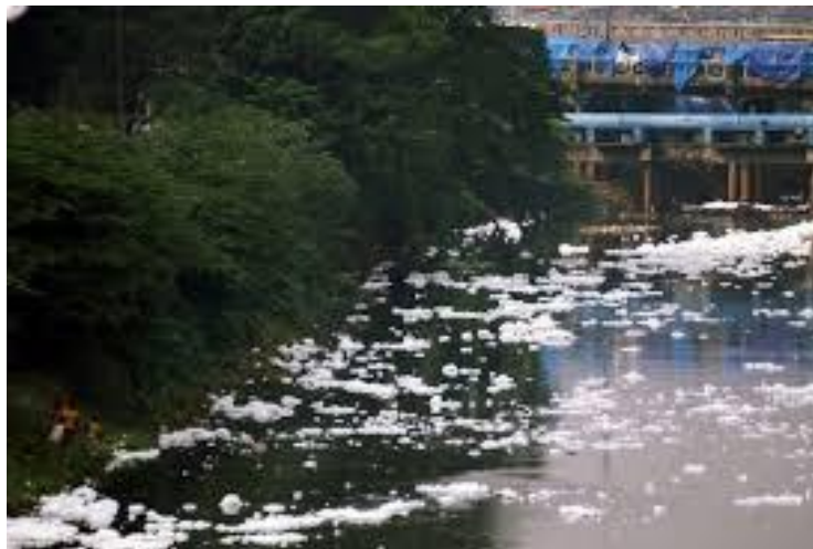
Gambar 6. Kerusakan lingkungan akibat industri

Mengenai kerusakan lingkungan yang disebabkan oleh industrialisasi, tujuan untuk menegakkan keseimbangan (mīzān) (QS. al-Rahman 55: 7-9) dan menahan diri dari pelanggaran (taghā) terhadap batasan yang ditetapkan oleh Tuhan atas alam, baik manusia maupun bukan manusia, sudah cukup untuk melindungi lingkungan tanpa perlu mengartikulasikannya nilai-nilai lingkungan secara terpisah.