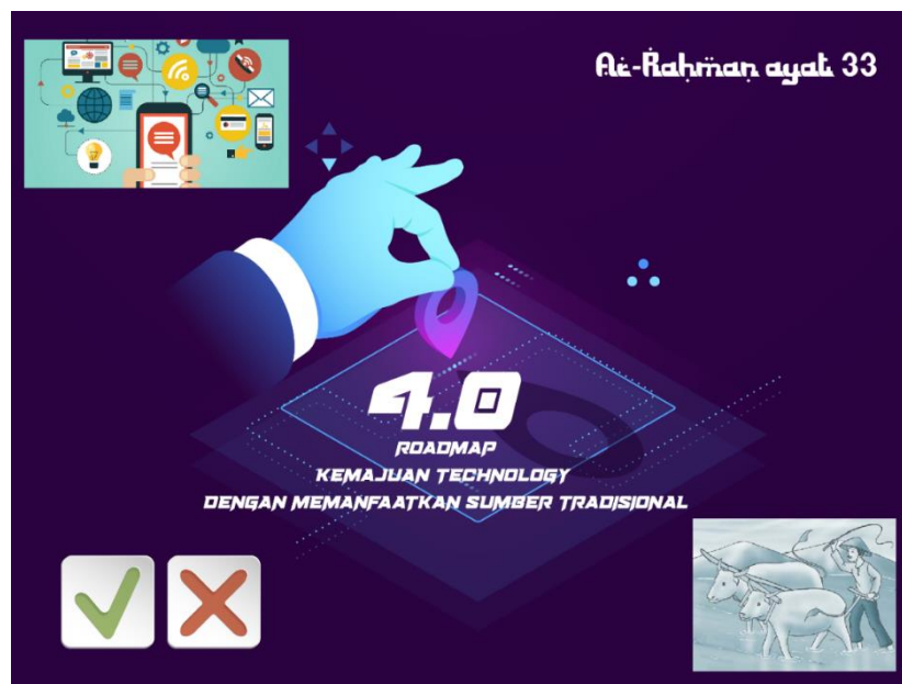
Gambar 5. Roadmap Kemajuan Teknologi

Seperti yang sudah dibahas sebelumnya yaitu bahwa teknologi berkembang sudah ada dalam surat Ar-Rahman ayat 33 yang memiliki isi kandungan tentang pentingnya ilmu pengetahuan bagi kehidupan umat manusia. Dengan ilmu pengetahuan, manusia dapat mengetahui benda-benda langit. Dengan ilmu pengetahuan, manusia dapat menjelajahi angkasa raya. Dengan ilmu pengetahuan, manusia mampu menembus sekat-sekat yang selama ini belum terkuak.. Sumber tradisional teknologi bisa dirasakan dimulai dari perkembangan teknologi terdahulu yaitu saat petani masih menggunakan kerbau untuk membajak sawah mereka, yang bisa kita rasakan saat ini yaitu petani dipermudah dengan traktor. Disisi lain teknologi memiliki sisi positif dan teknologi bagi kemanusiaan, sisi positifnya yaitu pertukaran sebuah informasi yang menjadi lebih mudah dan cepat, memudahkan pekerjaan, pekerjaan yang dapat dilakukan oleh satu orang menjadi lebih efektif dan efisien, sistem pembelajaran dapat dilakukan secara online tanpa harus melakukan tatap muka [35]. Sedangkan sisi negatifnya yaitu seperti kejahatan yang marak yaitu kasus hoax yang terjadi dimana-mana. Kemajuan teknologi memiliki manfaat yang terasa bagi umat manusia seakan-akan semua manfaat itu dapat dirasakan dalam sebuah genggam gadget yang dimiliki oleh manusia. Semua aktivitas manusia sekarang dapat dilakukan hanya melalui gadget mereka saja.