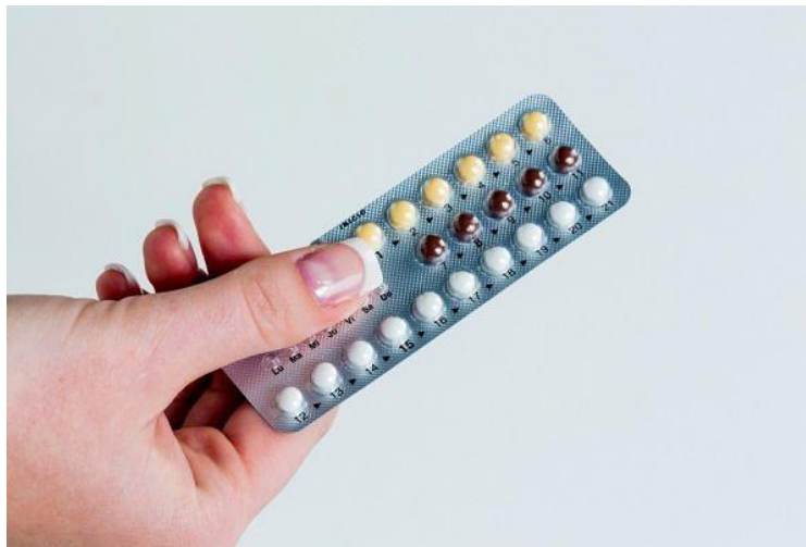
Gambar 4. Pil-KB

Ada lebih sedikit kehamilan yang tidak diinginkan sekarang, tetapi bahkan sedikit yang kurang diterima dibandingkan di masa lalu dan karenanya jumlah aborsi yang sebenarnya tidak menurun secara signifikan. Sebelumnya, beberapa orang memilih aborsi hanya jika kehamilannya sama sekali tidak diinginkan. Dengan lebih banyak pilihan teknologi untuk menjalani hidup sesuai dengan perencanaan dan keinginannya sendiri, banyak orang melakukan aborsi bahkan jika kehamilannya tidak direncanakan. Fakta bahwa orang-orang di masyarakat teknologi modern akhir menginginkan segala sesuatu terjadi sesuai dengan keinginan dan rencana mereka jelas dalam contoh ini. Studi ini menunjukkan bahwa praktik baru ini, yang dimungkinkan oleh teknologi baru, sering kali mengobati keinginan orang dan bukan penyakit mereka. Fakta bahwa artefak teknologi secara tidak langsung membawa perubahan yang luas dan mendalam pada moralitas dan mentalitas kita. Kasus pil kontrasepsi adalah contoh bagaimana artefak teknologi menciptakan makna dan definisi baru tentang kehidupan yang baik atau moral. Pengenalan pil kontrasepsi menyebabkan pergeseran persepsi sosial tentang pernikahan dan reproduksi.