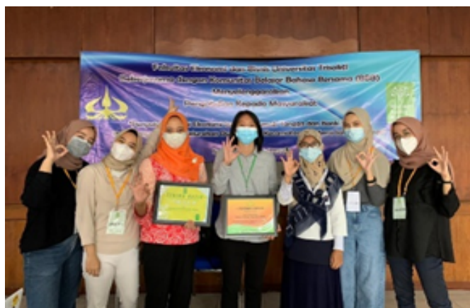
Gambar 6. Foto bersama dengan mitra Komunitas BBB

Kegiatan penyuluhan tentang sampah rumah tangga yang bersinergi dengan Komunitas BBB telah memberikan tambahan pengetahuan dan wawasan terkait dengan sampah dengan segala permasalahan dan manfaat ekonominya. Kegiatan telah berjalan lancar dan mendapat apresiasi dari mitra yang di tunjukkan dengan telah dimuatnya berita dan pesan yang disampaikan pada waktu kegiatan berlangsung [20]. Sebagai tindak lanjut dari kegiatan ini, Komunitas BBB kemudian menggagas program “membayar” biaya pendidikan (belajar) dengan sampah, untuk sementara menggunakan botol bekas air minum. Pada kegiatan berikutnya, diharapkan akan lebih berkembang kepada program-program lainnya untuk membuat masyarakat dan lingkungan menjadi semakin sehat, sejahtera dan lebih berdaya.