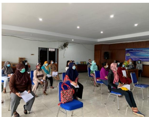
Gambar 2. Peserta Penyuluhan kegiatan PKM

Sebelum penyuluh memberikan materi tentang nilai ekonomi sampah rumah tangga, kepada peserta diajukan beberapa pertanyaan terkait beberapa hal. Pertama, persepsi/pengetahuan peserta tentang sampah rumah tangga, kemudian tentang pengetahuan peserta apakah sampah memiliki manfaat ekonomi, selanjutnya pengetahuan peserta bagaimana cara mendapatkan manfaat ekonomi sampah rumah tangga, serta pengetahuan peserta tentang produk daur ulang dari sampah rumah tangga [11]. Jawaban awal peserta ini akan digunakan sebagai acuan untuk pengetahuan awal peserta sebelum penyuluhan. Selanjutnya hasil kegiatan dianalisis dari kuesioner yang dibagikan kepada peserta. Kuesioner disusun sebagai kuesioner tertutup dengan bentuk pilihan ganda, dimana dalam kuesioner terdapat pilihan jawaban yang sesuai dengan responden [12]. Jumlah seluruh peserta adalah 57 orang, namun dalam mengisi kuesioner beberapa nomor ada yang terlewat dijawab oleh peserta, sehingga rekapitulasi jawaban menjadi tidak sama antarnomor.