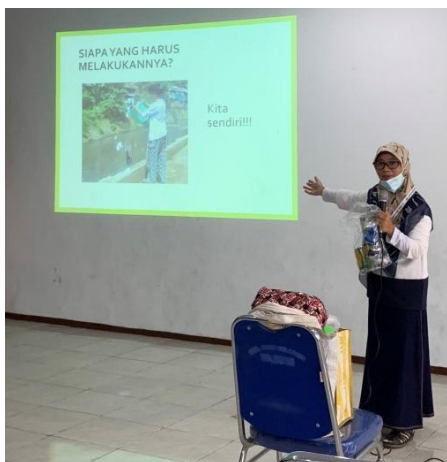
Gambar 1. Presentasi penyuluhan PKM