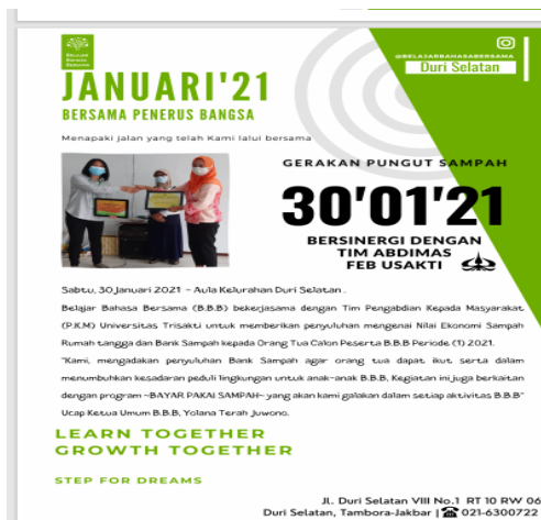
Gambar 5. Newsletter Kegiatan BBB

Berkaitan dengan produk daur ulang sampah sebagai upaya meningkatkan nilai ekonomi sampah rumah tangga, hasil kegiatan menunjukkan bahwa sebanyak 30 orang dari 53 (56%) peserta sedikit mengetahui produk daur ulang [17]. Kemudian 17,1% atau sebanyak 9 peserta sudah mengetahui dan hanya 26,3% atau 14 orang yang tidak mengetahui produk daur ulang dari sampah rumah tangga. Sebagian besar peserta menyatakan bahwa ketidaktahuannya pada produk daur ulang lebih berkaitan dengan masalah produksi (64,1%) atau cara membuatnya [18]. Untuk meningkatkan nilai ekonomi sampah melalui produksi daur ulang dapat dilakukan dengan cara belajar sendiri melalui chanel youtube . Tetapi sebagian besar (72%) peserta menginginkan ada pelatihan khusus untuk belajar membuat produk daur ulang dari barang-barang bekas yang dikumpulkan sendiri. Selain masalah produksi atau cara membuat, masalah pemasaran juga menjadi satu hal yang dikhawatirkan oleh peserta jika mereka sudah menekuni kegiatan tersebut [19]. Namun dalam era digital saat ini pemasaran dapat dilakukan secara online , dan itu dinyatakan oleh 55% dari total peserta atau sebanyak 29 orang.