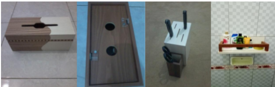
Gambar 6. Produk Yang Dihasilkan

Produk yang sudah selesai diproduksi kemudian dipasarkan dipasar tradisional, serta dipasarkan secara online melalui media sosial, sehingga dapat meningkatkan perekonomian masyarakat dari produk yang mereka produksi.