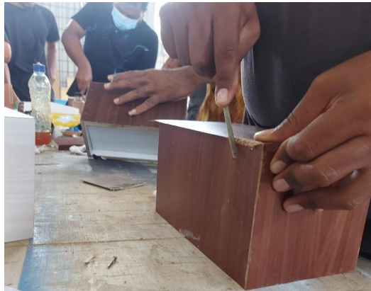
Gambar 5. Finishing Perapian Sisi HPL

Selanjutnya dilakukan teknik finishing, yang mana pada tahap ini produk yang sudah terangkai dilapisi HPL juga sebagai lapisan dibagian luar produk. Sama seperti pada bagian dalam, bagian yang dilapisi HPL juga dilakukan teknik pengeleman dan penghalusan agar sisi luar produk rapi dan menarik [17]. Proses perapian HPL dilakukan dengan menggunakan kikir sebagai alat pemotongan HPL, dan juga amplas sebagai penghalus bagian sisinya.