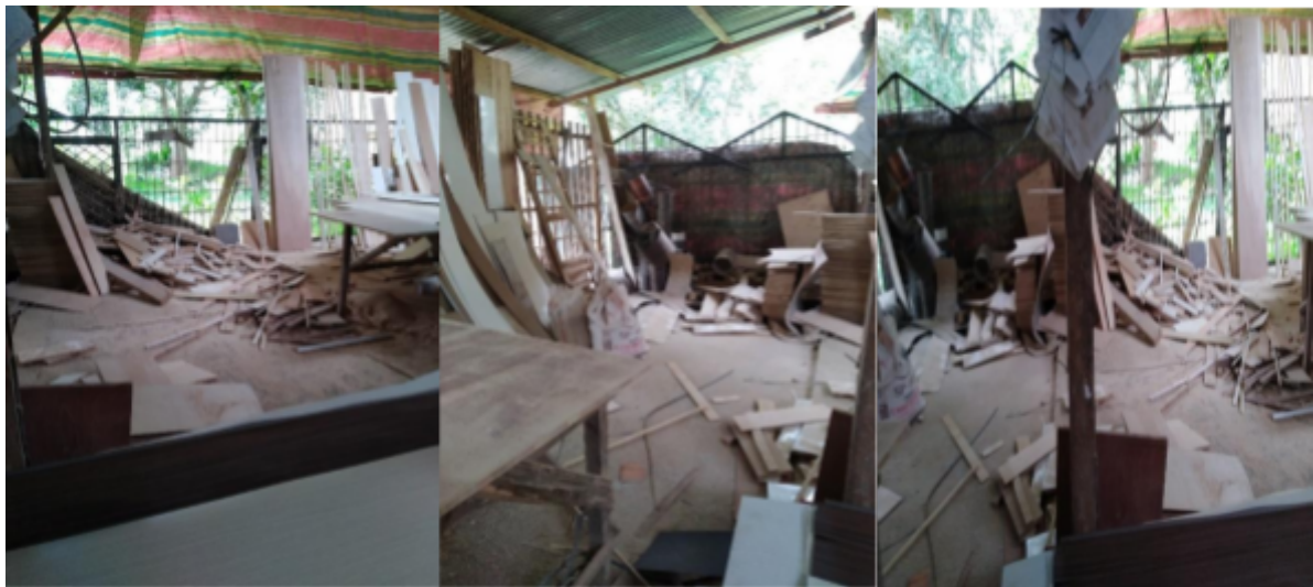
Gambar 1. Limbah Kayu Sisa Usaha Mebel

Fakta di lapangan menunjukkan masih terdapat faktor penyebab tidak adanya pengolahan limbah yaitu karena tidak adanya pekerja yang dapat mengolah limbah yang dapat bernilai ekonomis. Masyarakat di desa tersebut pun masih minim untuk menuangkan ide kreatifnya dalam memanfaatkan limbah kayu dengan desain yang menarik, sejatinya hal tersebut dapat menambah perekonomian mereka. Usaha kayu dapat memberikan keuntungan bagi pengrajinnya, hal ini dikarenakan banyaknya permintaan yang banyak tetapi dari bahan dasar yang tanpa modal, yaitu limbah. Pemanfaatan limbah kayu yang diolah menjadi berbagai macam produk dengan desain yang menarik mampu memberi keuntungan yang banyak bagi para pengrajin itu sendiri sehingga mampu meningkatkan perekonomian masyarakat. berikut ini hasil limbah kayu sisa usaha mebel.