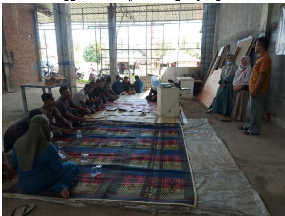
Gambar 2. Kegiatan Sosialisasi Pemanfaatan Limbah Kayu

Teori dan praktek dalam mengubah mindset masyarakat untuk dapat memanfaatkan limbah kayu sisa usaha mebel menjadi barang-barang keperluan rumah tangga dan kerajinan tangan yang bernilai ekonomi.