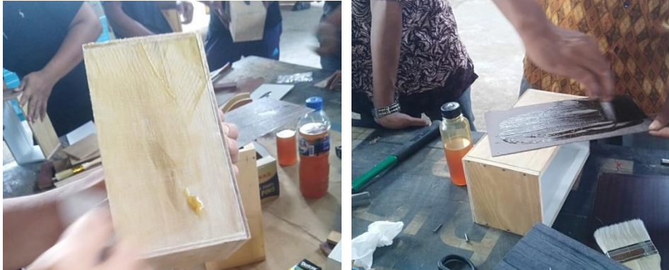
Gambar 4. Proses Pengeleman HPL

Selanjutnya dilakukan teknik finishing, yang mana pada tahap ini produk yang sudah terangkai dilapisi HPL juga sebagai lapisan dibagian luar produk. Sama seperti pada bagian dalam, bagian yang dilapisi HPL juga dilakukan teknik pengeleman dan penghalusan agar sisi luar produk rapi dan menarik [17]. Proses perapian HPL dilakukan dengan menggunakan kikir sebagai alat pemotongan HPL, dan juga amplas sebagai penghalus bagian sisinya.